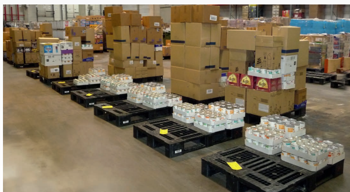
Préparation de commande dans l'une des plateformes logistiques d'Intermarché.

Le choix de l'enseigne française s'est porté sur la palette Craemer qui s'est révélée être la plus performante du marché. En effet, pendant près de deux ans, les équipes logistiques d'Intermarché ont effectué des tests sur 4 de leurs plateformes avec des palettes plastique de six fabricants différents. Trois critères ont été mesurés : le taux de perte, le taux de retour et le taux de casse. Ce dernier a été déterminant dans le choix de l'enseigne française. La palette Craemer s'est avérée très solide, contrairement aux autres, avec un taux de casse d'un pour mille, souvent lié d'ailleurs à des erreurs de manipulation. Sa conception monobloc liée au procédé de fabrication (moulage par injection thermoplastique) est beaucoup plus robuste qu'une palette assemblée.