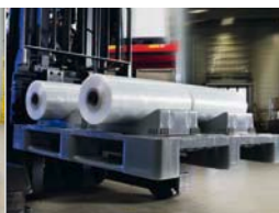
vier Rollen auf einer Palette