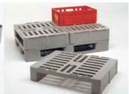
Ergänzung zur EURO H1