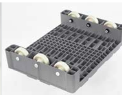
Ausstattung mit Rollen