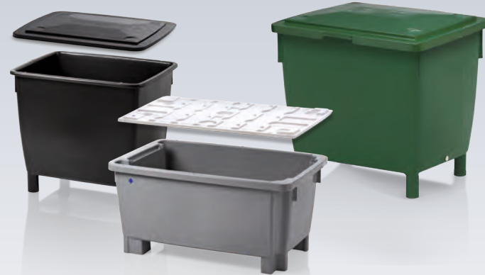
Bac gerbable et emboîtable 300 l