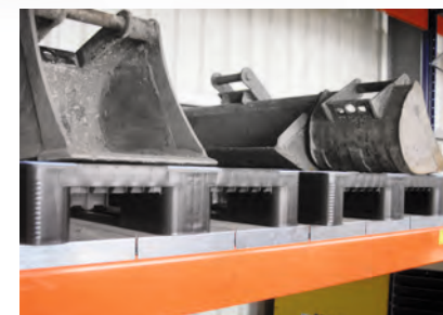
Exemple d'application: Stockage d'outillages sur CR1 Eco