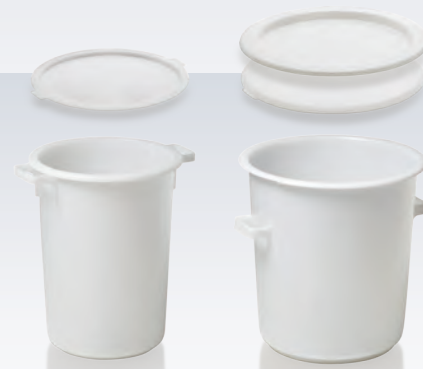
Bac rond 50 l

Créés pour de nombreuses applications, ces bacs sont adaptés à des usages aussi variés que le malaxage de colles ou mortiers ou le mélangeage. Leur qualité et leurs parois épaisses complètent une grande résistance chimique. Grâce à leur coloration claire, ils ne laissent aucunes traces noires derrière eux et sont idéaux pour préparer le stuck, ravalement ou autres mélanges.